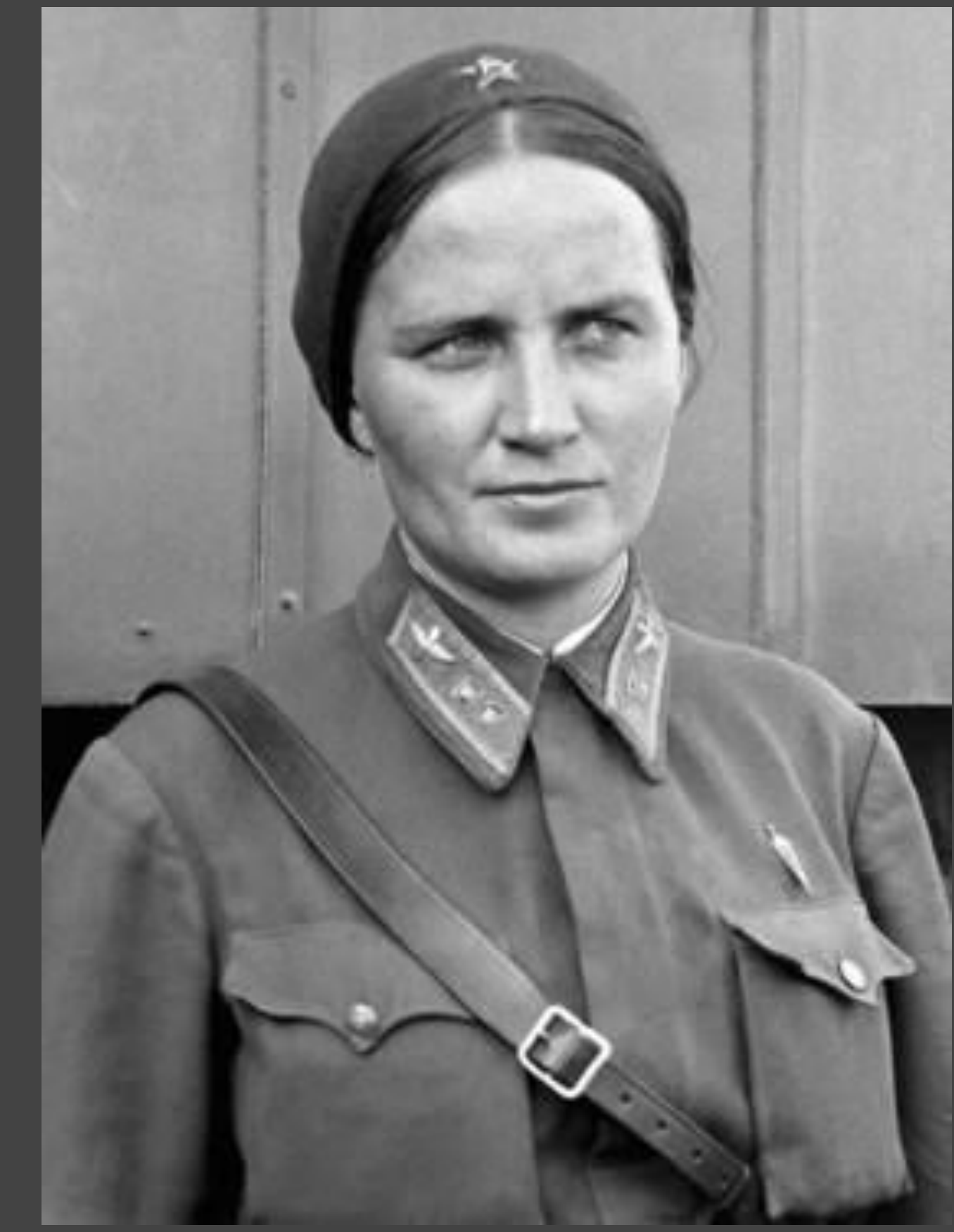
Image 1. Marina Raskova. The Ninety-nines Museum, of Women Pilots. Oklahoma, 2021. https://www.museumofwomenpilots.org/women-pilots-marina-raskova-48.htm